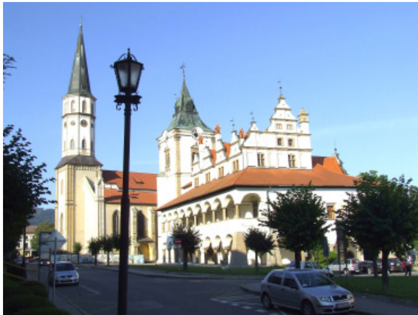
Leutschau - Rathaus mit St. Jakobskirche