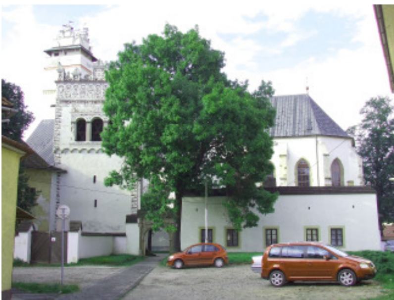
Glockenturm mit Basilika zum Hl. Kreuz

Wir besuchten noch die Basilika zum hl. Kreuz, die jüngste gotische dreischiffige Kirche der Zips, erbaut von 1444 bis 1498. Neben der Basilika befindet sich ein alleinstehender Glockenturm. Er wird von einer Attika im Stil der Renaissance geschmückt. Diese Art Glockentürme gibt es hauptsächlich im Gebiet der Popper (Poprad).