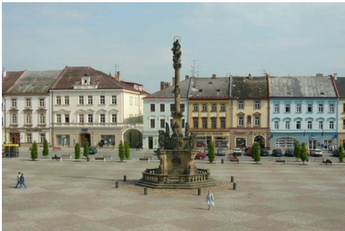
Mährisch Trübau Stadtplatz