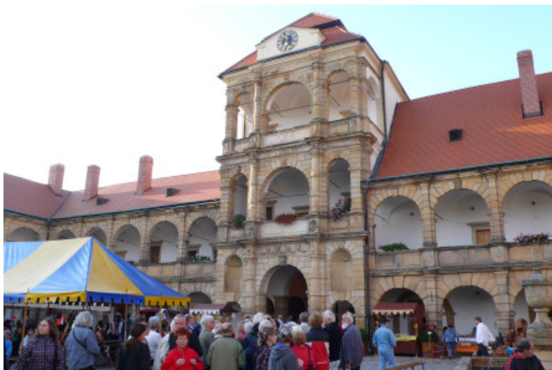
Mährisch Trübau Schloss