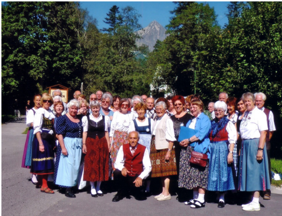
Teilnehmer der Singwoche vor der Lomnitzer Spitze