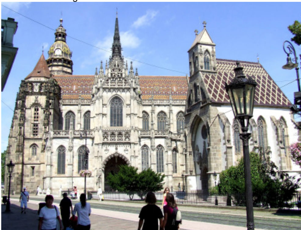
Kaschau - Dom zur Hl. Elisabeth mit Michaelskapelle

Zuerst war der Dom mit einer Führung der Auftakt zur Stadterkundung. Die Mittagspause verbrachten die meisten Teilnehmer im angrenzenden kleinen Park bei schönstem Wetter mit den „musikalischen Wasserspielen“. Alleine oder in kleineren Gruppen wurde die Stadt erwandert. Gelegenheiten zum Einkauf gab es genügend! Voll mit imposanten Eindrücken traten wir die Fahrt Richtung Hotel an.