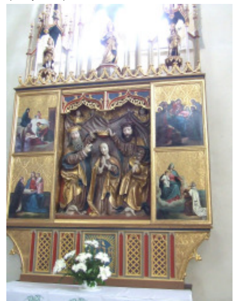
Altar Mariä Krönung